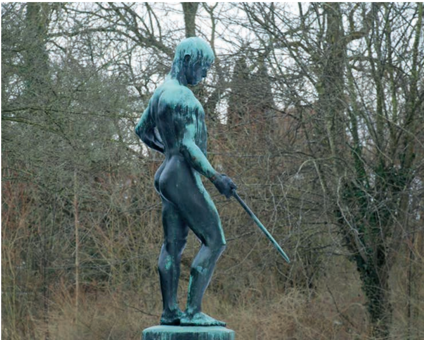
Skulpturen Uffe kom til Kolding i 1947.