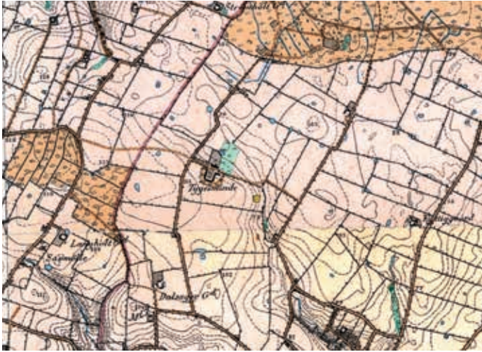
Gården Thygesminde. Lave målebordsblade 1901-1971.

tilbragte de dog ofte somrene på Thygesminde eller i et lejet hus i Strandhuse.