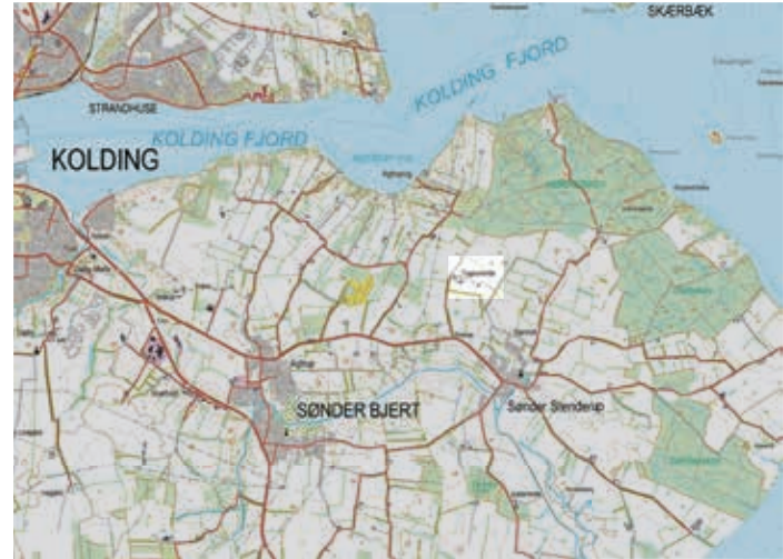
Nyt kort. Kort & Matrikelstyrelsen.