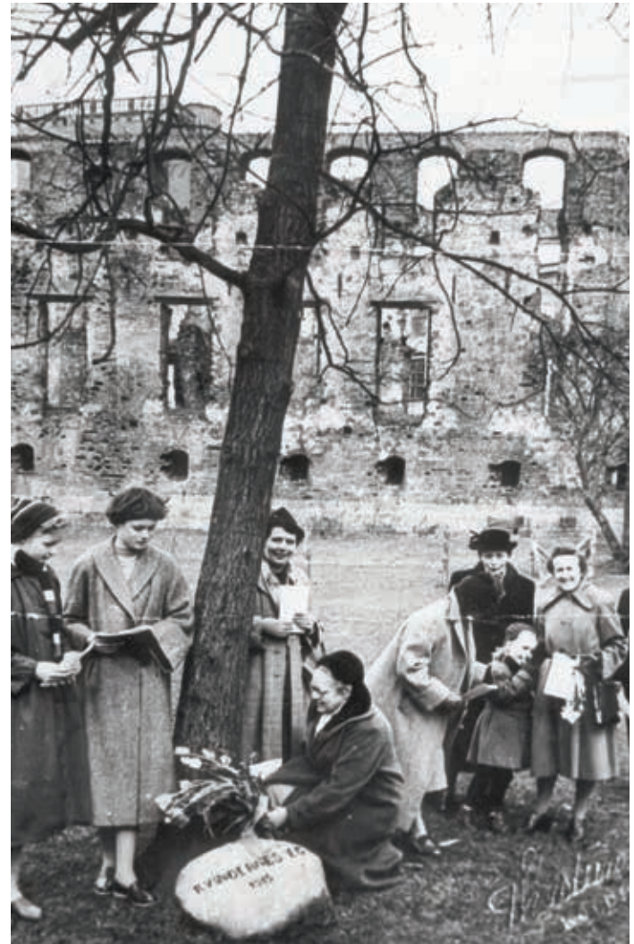
Dansk Kvindesamfund på besøg ved Kvindernes Eg ved Koldinghus omkring 1950.

Derudover var hun en kvinde, der ville og kunne selv. Det viste sig især i hendes målrettethed i sin kunst, men også i hendes privatliv. Hun var som kvinde, mor og kunstner på mange måder kompromisløs. Hun var kompromisløs i sin formgivning og brugte megen tid på at få den givne model rigtig. Dette gik til tider ud over familien; blandt andet da den hest